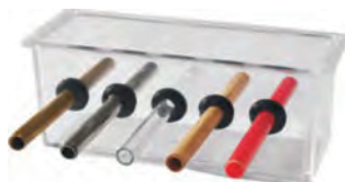
Dispositivo per esperimenti di confronto della conducibilità termica dei materiali