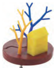
Esempio di terra

Il kit didattico rende possibile comprendere le proprietà del calore attraverso la temperatura, la modalità di trasmissione del calore, la conducibilità termica dei materiali.