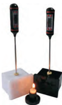
Esperimento di radiazione termica