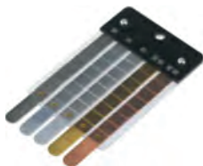
Contatore di calore specifico per metallo